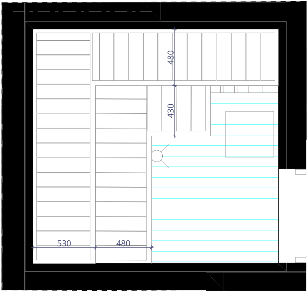
D-43 D-43 SAUN 2 1:20