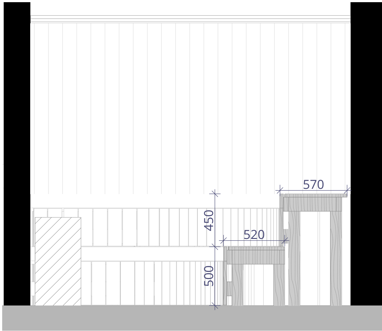
LÕIGE SAUN 1 1:20